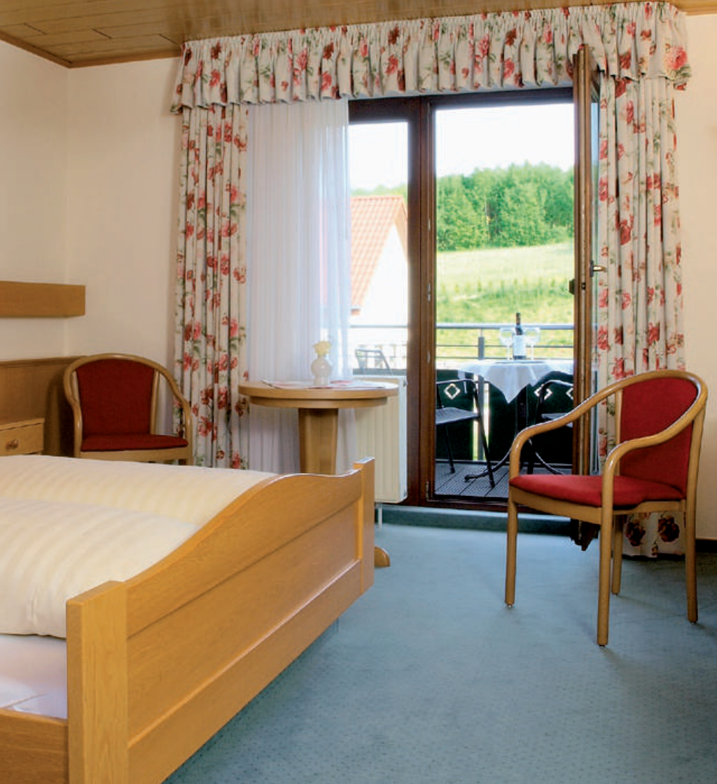
Zimmer im Landhotel Kehls Frühstücksbuffet Außenansicht des Landhotels Seminarraum im Landhotel