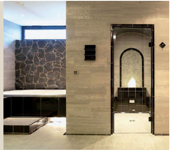
Wellnessbereich im Landhotel Dampfbad mit Ziegelsteinofen Sauna mit heißem Stein Dampfbad und Whirlpool